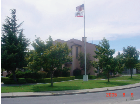
La oficina de SUBA está localizado dentro de la vieja estación de Bomberos sobre la calle Alisal.

SUBA offices are located at the old Firehouse on Alisal Street.