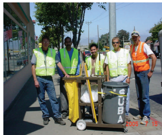
El equipo de limpieza de SUBA estaran trabajando los lunes, miércoles y viernes.

Para obtener más información acerca del programa de LIMPIEZA Y EMBELLECIMIENTO DE NUESTRAS CALLES ó para cualquier pregunta puede comunicarse a la oficina de SUBA al 796-0896 ó mandandonos un correo electronico a director@salinassuba.org